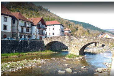
El Centro de Interpretación de la Naturaleza de Ochagavía.

Está en la calle Labaria 21, en Ochagavía.