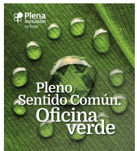
Foto: portada de la guía.